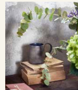
Oude boeken (12 euro, whiterosebrocante.nl), mok met oor (17,50 euro, ateliernaturalart.nl)