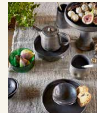
Ontbijtbordje (27,50 euro), taartplateau (29,50 euro), theepotje (52,50 euro), grote mok (15,50 euro), ongelijk bordje S (9,50 euro), lepels (4,50 euro, alles ateliernaturalart.nl)