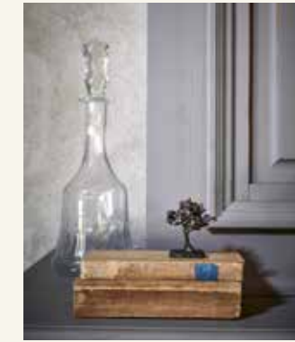
Glazen karaf (9,95 euro), boeken (12 euro, alles whiterosebrocante.nl), bronzen boompje (150 euro, dekunstraad.nl)