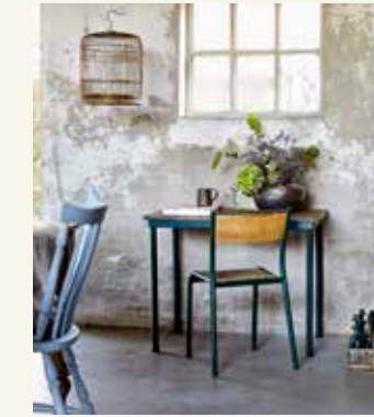
Stoel van hout en staal (37,95 euro), tafeltje (47,95 euro), vogelkooi (20 euro), flesjes in kratje (6,50 euro per stuk, alles whiterosebrocante.nl), vaas met gaten (225 euro, ateliernaturalart.nl), kunstboek Hippshieg (40 euro, taschen.com), bloemen (prijs op aanvraag, intensbloemen.nl)