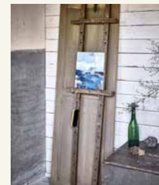
Bankschroef (55 euro), borsteltje (5 euro), groene flesvaas met kaarsenhouder (9,95 euro), oude stempels (55 euro), oude deur (55 euro), dekenkist (45 euro, alles whiterosebrocante.nl), schilderij 24x30 cm (250 euro, dekunstraad.nl)