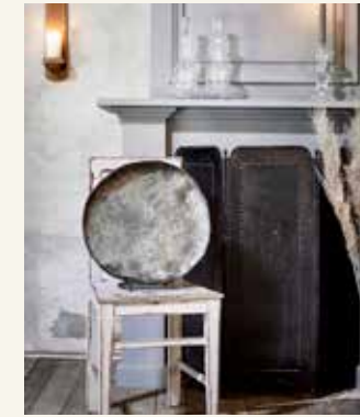
Houten stoel (15 euro), haardscherm (40 euro), glazen kandelaar (12,50 euro, alles whiterosebrocante.nl), keramiek bord (425 euro, ateliernaturalart.nl)

Een andere leuke optie: een oude deur of verweerde, houten wandbeplanking in combinatie met een leuk schilderij. Stoere en ruwe materialen en vormgeving combineer je op deze manier met de zachte uitstraling van het schilderij.