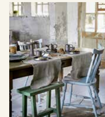
Hanglamp (145 euro), groen krukje (37,95 euro), blauwe stoel (35 euro), houten tafel (125 euro), koeienkleed (180 euro, alles whiterosebrocante.nl)