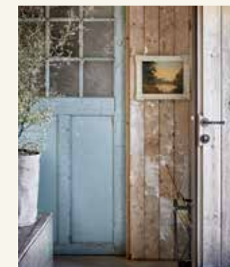
Paraplubak (28,50 euro), linnen pot (17,99 euro, beide whiterosebrocante.nl), Corokia-plant (90 euro, intensbloemen.nl)